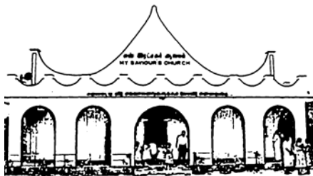
Fortsetzung von S. 1 My Saviour's church, Sri Lanka - Frühlingssammlung

Dessen ungeachtet arbeitet Rajapakse hart daran, diese Perle in eine Träne zu verwandeln!