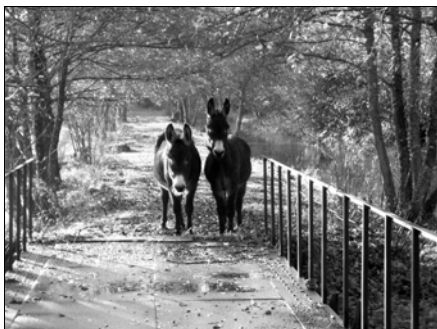
Wo geht es da wohl lang?

Dienstag, 12. Februar 2008, 13.30 Uhr im Kirchgemeindehaus Rohrbach.