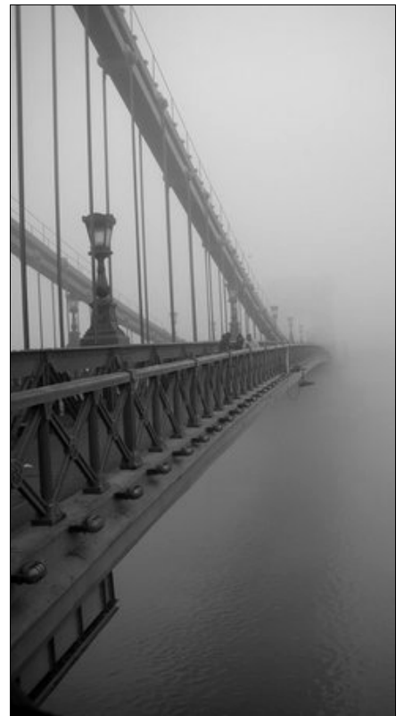
Brücke in Budapest

Wir laden Sie herzlich ein, bei diesem anregenden und spannenden Experiment mit dabei zu sein und sich „Ediths Gottesdienst“ nicht entgehen zu lassen.