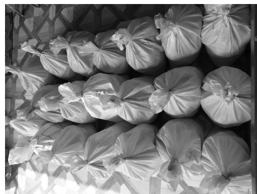
Essenspakete zum Verteilen

Die My Saviour's Church (MSC) konnte und kann Dank unserem Oasisprojekt vielen Witwen und armen Familien mit regelmässiger Essensverteilung helfen. Für Hindus ist es nicht verständlich, dass ihnen jemand hilft, so entstanden viele Fragen: Wer seid ihr, warum helft ihr uns, wer oder was ist Gott? Es kam so zu vielen neuen Kirchenmitgliedern, vor allem im armen Norden. Vielleicht darf man auch sagen, dass Menschen in Krisen nach dem Sinn des Lebens fragen und sogar Gott suchen?