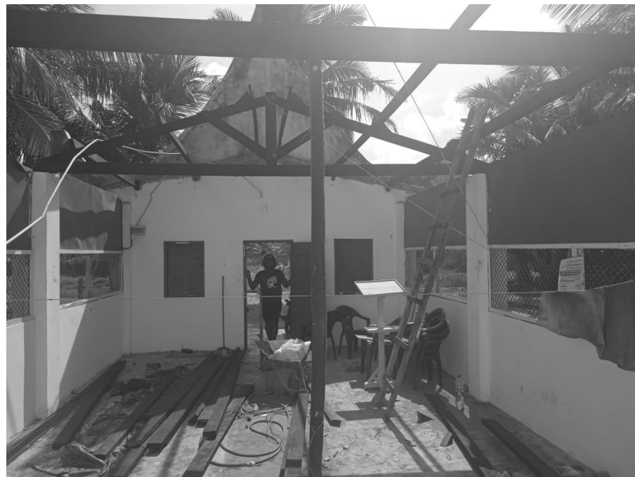
Die Kirche in Munrampidi erhält ein neues Dach